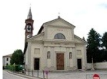
Parrocchia S. Antonio Abate Pozzo d'Adda