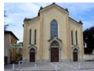
Parrocchia SS. Redentore Bettola d'Adda